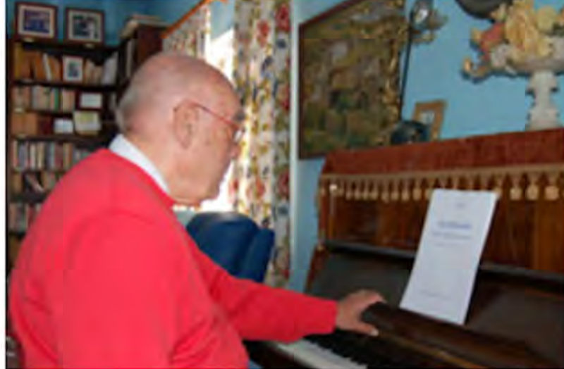
Imagen de archivo de Luis Cobiella Cuevas.

El intelectual padecía una enfermedad desde hace algunos años. La labor docente y cultural de Cobiella lo convierten en una de las personalidades más notables de los últimos tiempos.