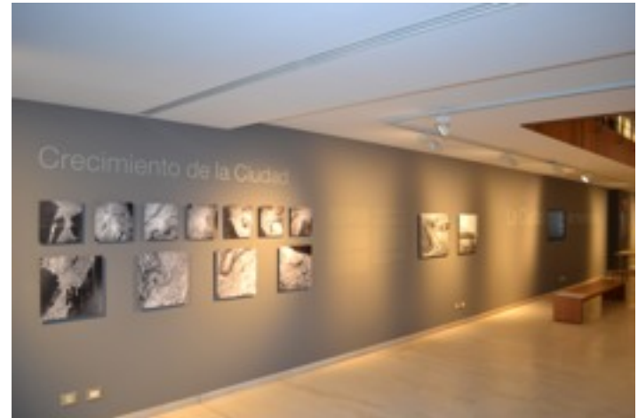
Fig. 3 – Vista sala siglo XIX.