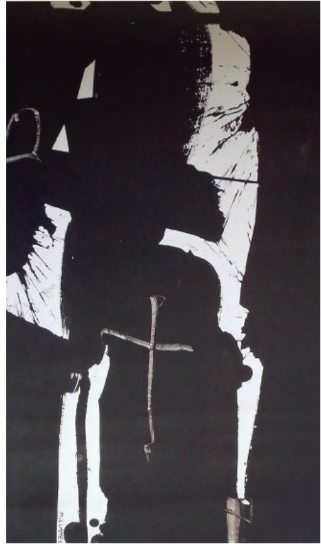
Sin título, pintura sobre papel, 44x32 cm, 1964. Colección privada.

En estos primeros años de los sesenta, la presencia de Manolo Millares en el panorama artístico nacional e internacional se había afianzado. De hecho, había fundado junto con Antonio Saura el grupo El Paso en 1957 y desde entonces los artistas que lo formaban, unidos en torno al informalismo abstracto, se habían consolidado como los grandes artistas