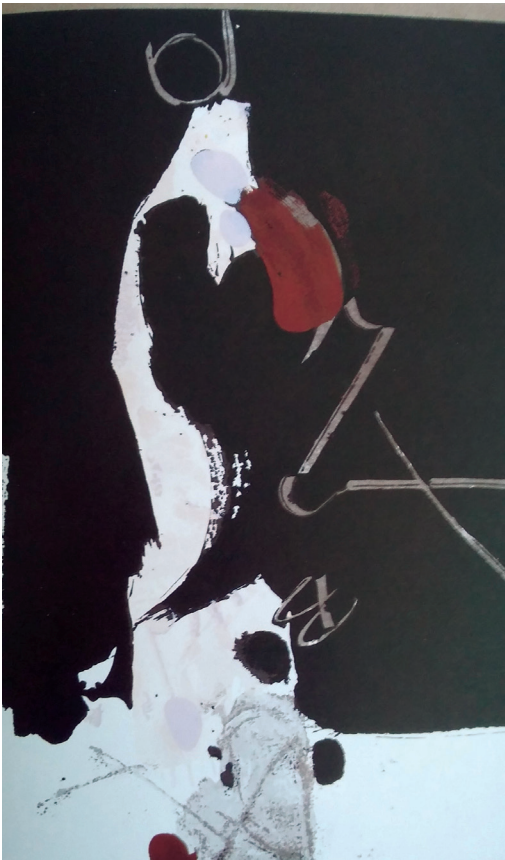
Mutilados de paz, serigrafía, 45/100, 34'5x24'5 cm, 1965, col. Privada.

Dedicada a su padre, pues así reza la carpeta con las cuatro serigrafías: «A mi padre, el primer mutilado de paz que conocí», es sin embargo lo que le impide acudir junto a su lecho de muerte. Manolo Millares, cuando crea la carpeta de grabados inspirada en un poema de Alberti, «Millares 1965», estaba realizando un homenaje casi póstumo a su progenitor. Junto a las cuatro serigrafías, trasuntos sobre papel del volumen y color de sus arpilleras y continuación de una serie de pinturas sobre papel realizadas en 1964., publica el poema de Alberti que originalmente llevaba el título de «Mutilados de paz»: