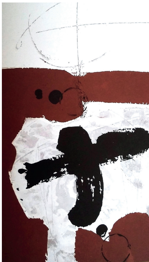
Mutilados de paz, serigrafía, 45/100, 34'5x24'5 cm, 1965, col. Privada.

Le agobia y angustia no poder librarse de sus compromisos profesionales. La recepción de una carta de su hermano Agustín en la que le comunicaba la gravedad final de su padre y la imposibilidad de acudir junto a su lecho de muerte le atenaza de angustia: