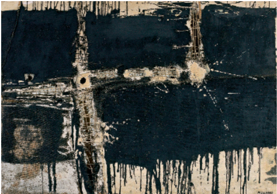
Cuadro 16, técnica mixta sobre arpillera, 84x118 cm. 1957, Cl. TEA Tenerife Espacio de las Artes.