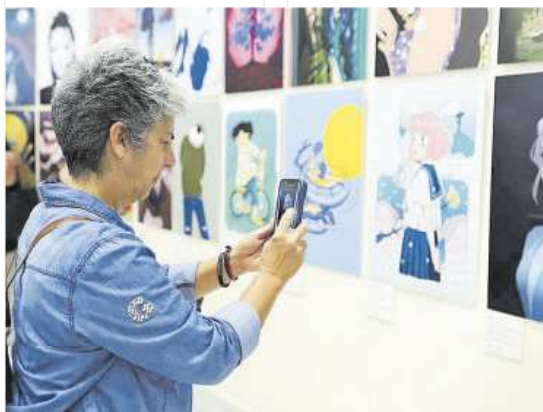
Un detalle de la muestra.

La exposición, que se inauguró ayer, permanecerá abierta hasta el 8 de junio y, como en los años anteriores, Ediciones Idea colaborará con la Fundación para editar un catálogo de la muestra. Presumiblemente, la presentación del libro será en la Biblioteca del Parlamento de Canarias y contará tam-