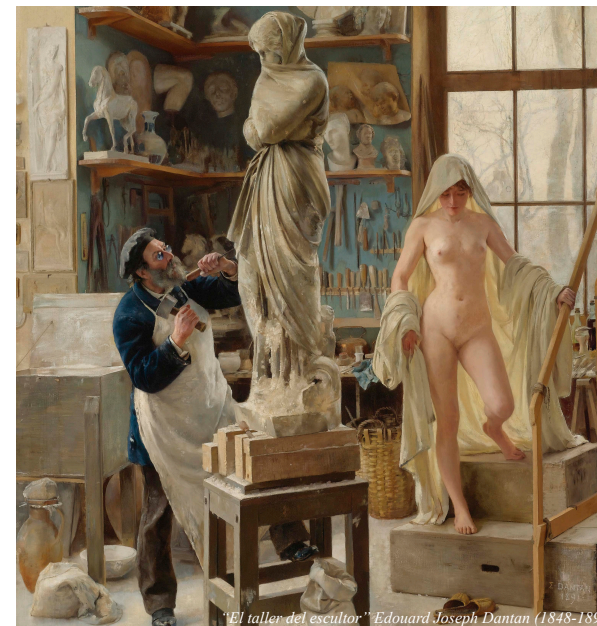
"El taller del escultor" Edouard Joseph Dantan (1848-1897)