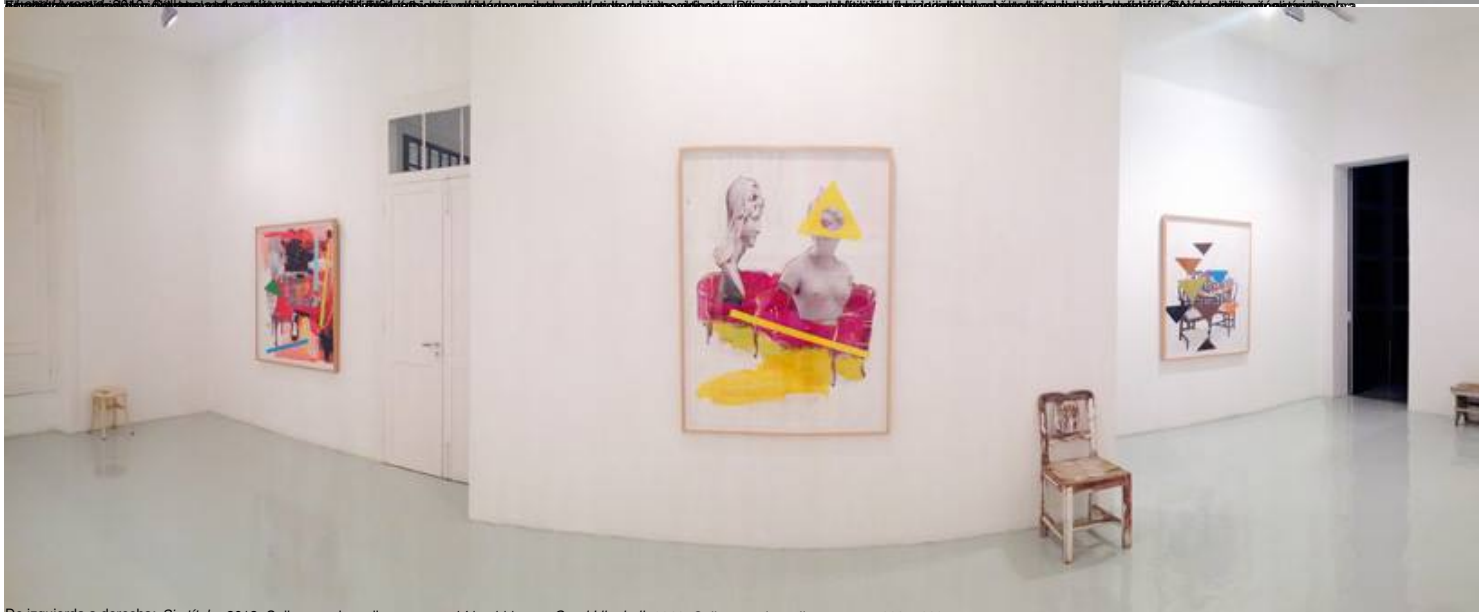
De izquierda a derecha: Sin título, 2012; Colores and líneas en rojo, 1964; Sin título, con un Correo de Bell, 2012; Colores and líneas en amarillo, 1964; Sin título, 2012; Colores and líneas en negro, 1964; Sin título, 2012; Colores and líneas en rojo, 1964; Sin título, 2012.