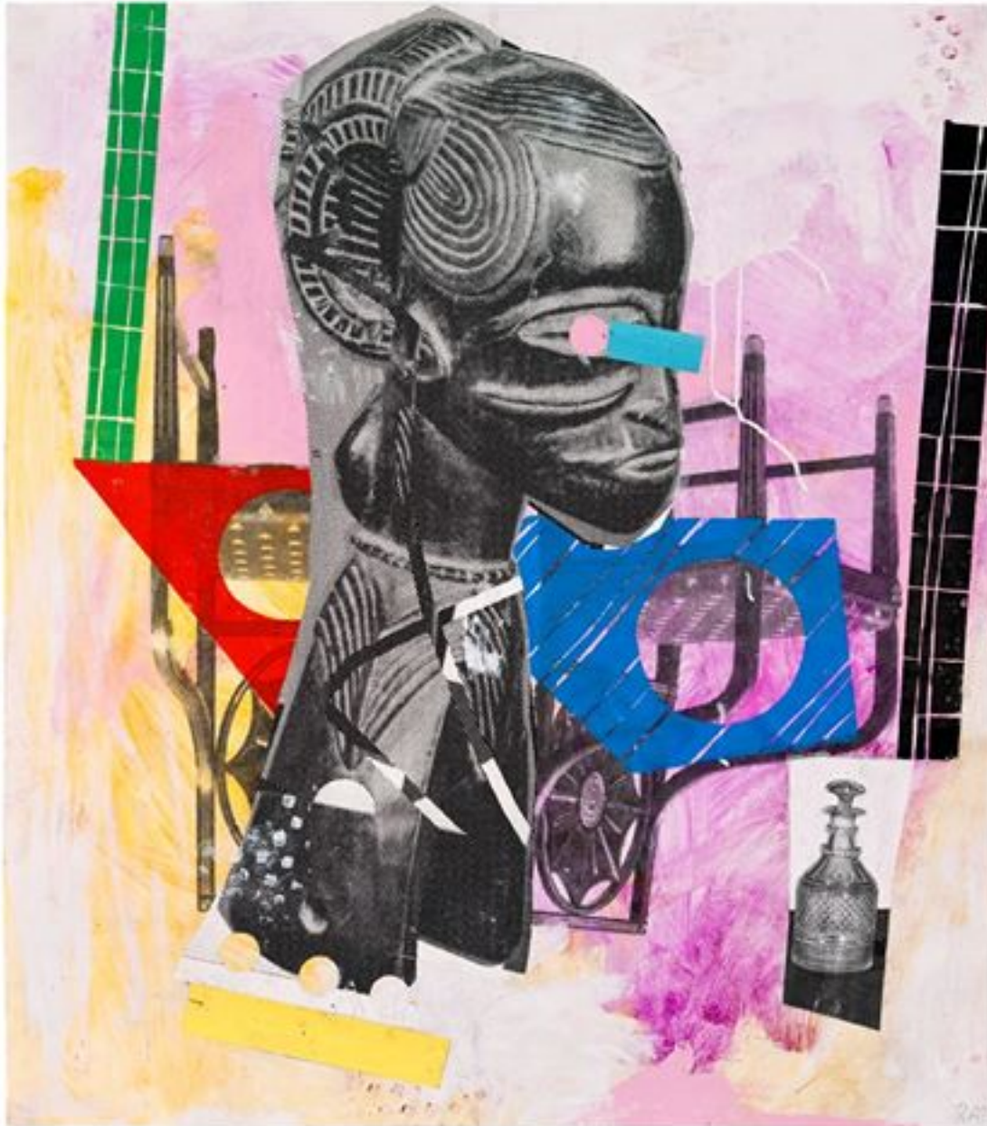
Reed Anderson, 2013. Collage and acrylic on paper. 101 x 91 cm. www.reedanderson.com